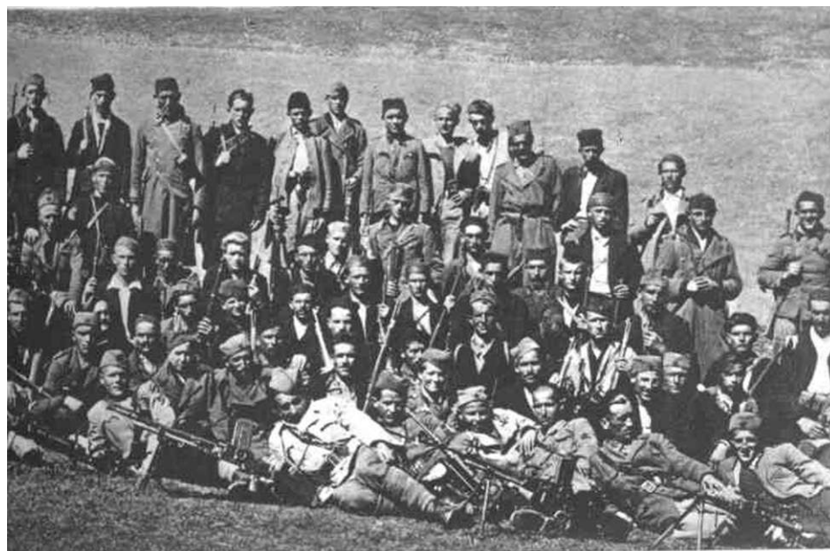
BJELOPOLJSKI PARTI- ZANSKI BATALJON NAKON FORMIRANJA. SRE DINOM 1943 GODINE